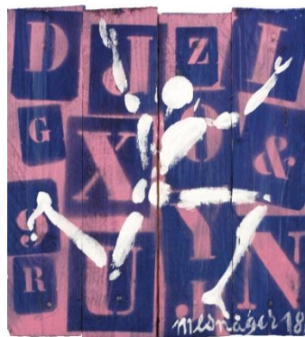
La Vie En Rose, 2018, Acrylique sur bois, 35 x 31,5 cm

En janvier 1983, Jérôme Mesnager invente l'Homme en blanc, « un symbole de lumière, de force et de paix ». Cette silhouette blanche appelée Corps blanc ou l'homme blanc, il l'a reproduite à travers le monde entier, des murs de Paris à la muraille de Chine. Un véritable tour du monde : des géants de Ménilmontant à la Place Rouge de Moscou, les personnages articulés sont partout !