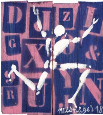
La Vie En Rose, 2018, Acrylique sur bois, 35 x 31,5 cm

En janvier 1983, Jérôme Mesnager invente l'Homme en blanc, « un symbole de lumière, de force et de paix ». Cette silhouette blanche appelée Corps blanc ou l'homme blanc, il l'a reproduite à travers le monde entier, des murs de Paris à la muraille de Chine. Un véritable tour du monde : des géants de Ménilmontant à la Place Rouge de Moscou, les personnages articulés sont partout !